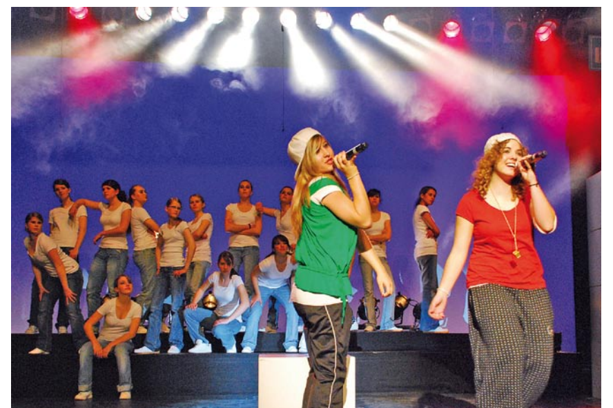
Schon über 500 Jugendliche haben beim Jugendmusical mitgemacht.

Infos und Anmeldung: www.jugendmusical.net oder 0848 104 104.